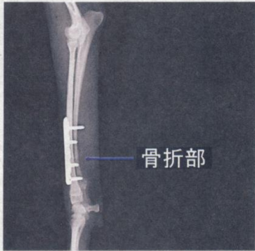
骨折部にプレートを入れたトイ・プードルの足のレントゲン画像